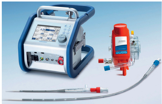
ECMO-Gerät inklusiv Zubehör